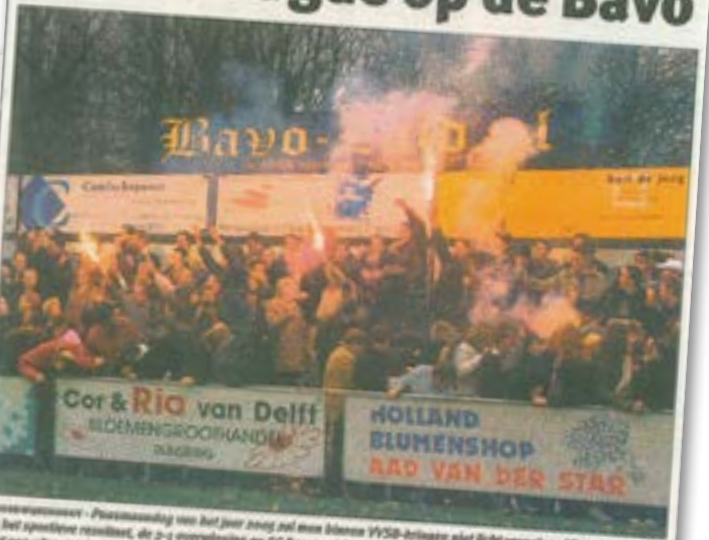
Feestvreugde op de Bavo na de 2-4 overwinning op SC Feyenoord, maar zeker zal ook het merendeel toeschouwers park de Bavo het op het gezicht van de VVSB-penningsmeester. Dankzij de rage op de eerste concurrent bleef VVSB nu een marge van 7 punten toe spijelen van de Rotterdammers. De feitelijke promotie naar de hoofdivisie ligt voor het grijpen. Met verslag van VVSB tegen SC Feyenoord, opgesteld door correspondent Henk Geurts/Wimma Segers.